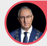
Ahmed Aboutaleb Rotterdam

"Taal opent deuren naar nieuwe werelden."